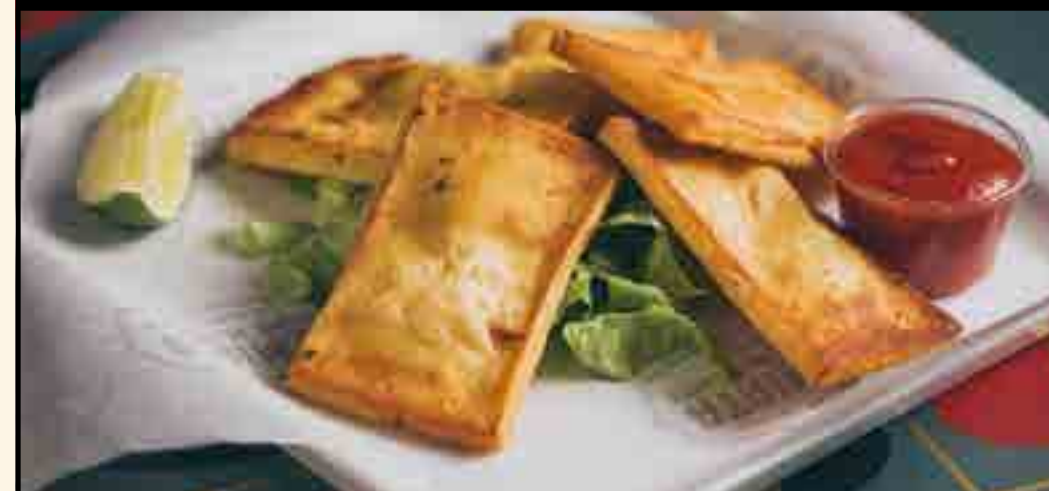
Frittelle di farina di ceci con lime.